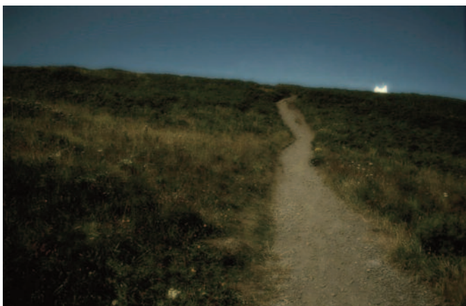
1981 Mijn eerste foto voor "het doosje"